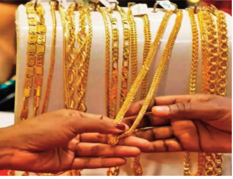
24 క్యారెట్ల బంగారం ధర రూ.1,55,730గా, 22 క్యారెట్ల పసిడి ధర రూ.1,42,750గా ఉంది. దేశవ్యాప్తంగా ఢిల్లీలో 24 క్యారెట్ల పసిడి ధర రూ.1,55,880గా, 10 గ్రాముల అల్పమెంటల్ పసిడి

న్యూఢిల్లీ, జూన్ 5 : భారత్ లో బంగారం ధరల్లో పతనం కొనసాగు తోంది. గత రెండు రోజులుగా తగ్గిన బంగారం ధరలో శుభ్రవారం కూడా స్వల్ప స్థాయిలో కొత పడింది. అయితే, కొన్ని రోజులుగా స్థిరంగా ఉంటున్న వెండి ధర మాత్రం తగ్గింది. గుడ్ రిటర్న్స్ వెబ్ సైట్ ప్రకారం, ఉదయం 10.30 గంటల సమయంలో హైదరాబాద్ బులియన్ మార్కెట్ లో 24 క్యారెట్ల 10 గ్రాముల పసిడి ధర రూ.1,55,730కు పడిపోయింది. నిన్నటి ముగింపుతో పోలిస్తే ధరలో రూ.380ల మేర కొత పడింది. ఇక 22 క్యారెట్ల 10 గ్రాముల బంగారం ధర కూడా రూ.350ల మేర తగ్గి రూ.1,42,750కు చేరుకుంది. ఇక నగరంలో కిలో వెండి ధరలో రూ.5 వేల మేర కొత పడింది. ప్రస్తుతం కిలో వెండి రూ.2.8 లక్షలుగా ఉంది. విజయవాడలో కూడా దాదాపు ఇవే రేట్స్ ఉన్నాయి. ఇక దేశవ్యాప్తంగా 24 క్యారెట్ల 10 గ్రాముల పసిడి ధర నగలున రూ.350ల మేర తగ్గింది. చెన్నైలో ప్రస్తుతం 24 క్యారెట్ల పసిడి ధర రూ.1,57,960గా ఉంది. 22 క్యారెట్ల 10 గ్రాముల బంగారం ధర రూ.1,44,300గా ఉంది. ముంబైలో